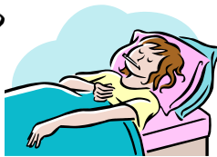
びょうき 病気です

ケガや痛 いた いところはどこですか？ 伝えたいこと、何 なん でも書 か いてください。