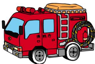
しょうぼうしゃ 消防車