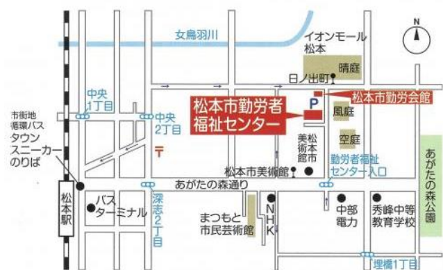
松本市勤労者福祉センター（松本市中央 4-7-26）